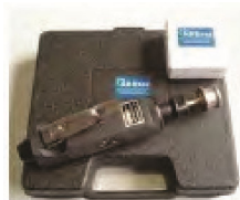
Kit completo neumatico Fresadora neumatica para muelas con eje