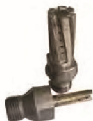
Fresas de diamante Fresas para cnc d.10 Hasta d.20Mm