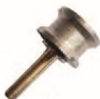
Muelas con eje Muela de d.25 Con eje de 6 canto trapecial