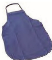
11000350 Delantal proteccion agua grueso blanco