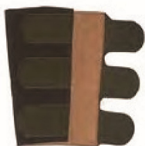
11000465 Muñequera grande de cuero con velcro