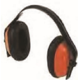
11000100 Cascos antiruido