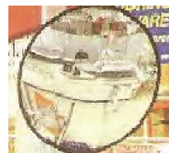
Espejo circular de caja 40Cms 60cms y 75 cms