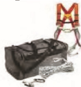
11000300 Bolsa con arnes y accesorios