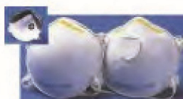
11000600 Mascarilla papel con valvula ffp2