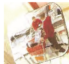
Espejo línea fija 60x40cms Para espacios reducidos