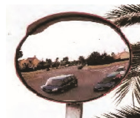
Espejo tráfico acrílico 60/80 cms