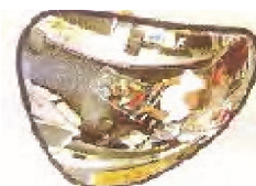
Espejo triangular Caja 33x33 cms