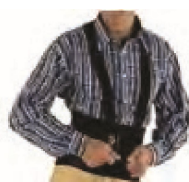
11000305 Cinturon ajustable antilumbago l-x-xl