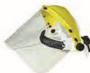
1100120 Casco con proteccion facial abs