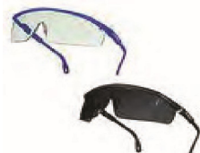
11000205 Gafas de proteccion de diseño